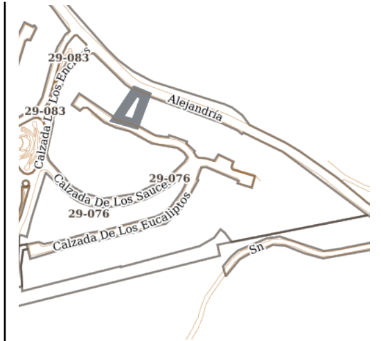
Croquis de Manzana